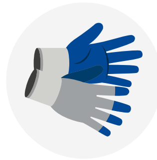
GUANTES DE VAQUETA