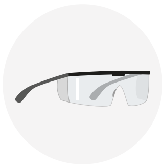
GAFAS DE SEGURIDAD