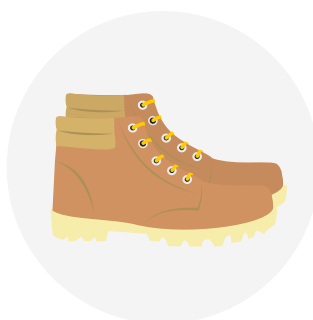
CALZADO DE SEGURIDAD