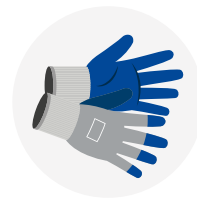
GUANTES DE VAQUETA