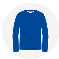
ROPA DE TRABAJO