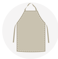
MANDIL O PETO