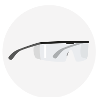
GAFAS DE SEGURIDAD