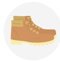
CALZADO DE SEGURIDAD